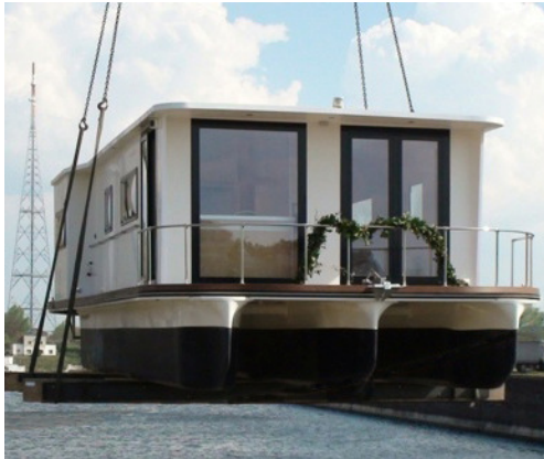
Hausboot SEADES 39 TA

Liebe Wassersportfreunde, mit der Sommerzeit wächst die Sehnsucht sich von Zeit zu Zeit vom Alltag loszureißen, um sich eine frische Brise um die Nase wehen zu lassen und dabei gemütlich seine Freizeit auf dem Wasser zu verbringen. Nichts ist dafür besser geeignet als ein Hausboot, was man sich nach seinen eigenen Wünschen und Vorstellungen geschaffen hat. Freiheit komfortabel erleben ist unser Motto mit dem wir Ihnen helfen, Ihre Ideen in die Tat umzusetzen.