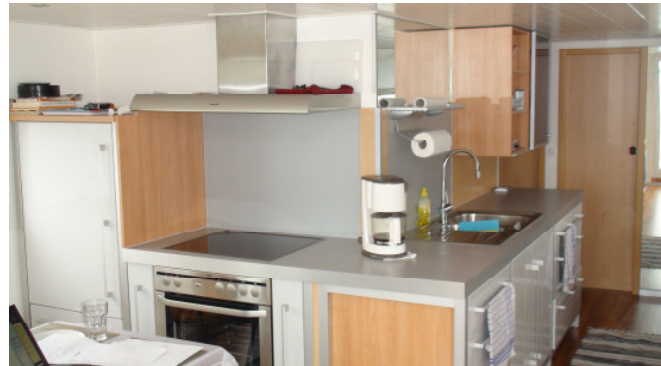
Innenraum / Einbauküche SEADES 39 TA

Der Stapellauf und die Taufe des Pontonhausbootes SEADES 39 TA erfolgte Ende April im Magdeburger Handelshafen. Das Boot fand seinen Heimathafen vorerst in Berlin und soll dort verchartert werden.